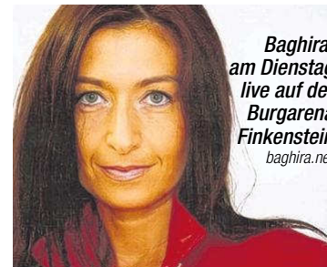
Baghira, am Dienstag live auf der Burgarena Finkenstein baghira.net

Begleitet wird Baghira von einem Neun-Mann-Orchester: „Sie alle sind Spitzenmusiker aus Kärnten und Osttirol, großteils Absolventen des